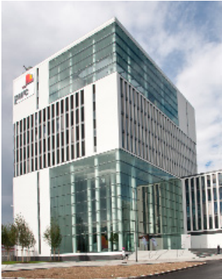
PwC GmbH 地図)